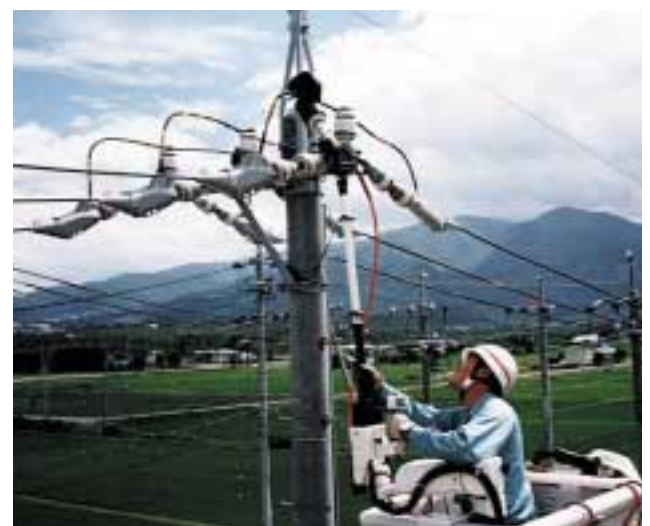
第2図 開発品とスーパーアームによる電線接続作業

この工具による施工を明確にするため、圧縮作業後の確認マーキング工具を開発し、スリーブカバーへのマーキングを義務付けた。