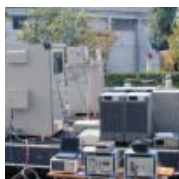
残留電荷装置の現場試験状況