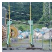
PS電線の弛度確認試験状況