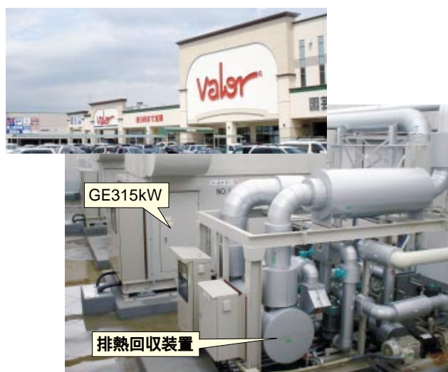
写真1 バロー宮西ショッピングセンター外観(上) およびガスコージェネレーションシステム(下)

この事例は、お客さまの二次側設備まで含めたトータルシステムの提案ですが、今後はさらに熱源機器や排熱利用設備などオンサイトエネルギーサービスの範囲を拡大した提案や、高速遮断器などを利用し供給信頼度向上対策を付加した提案などサービスの高付加価値化に取り組んでいきたいと考えております。