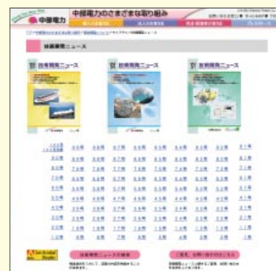
当社のホームページ

http://www.chuden.co.jp/torikumi/fr_kenkyu.html