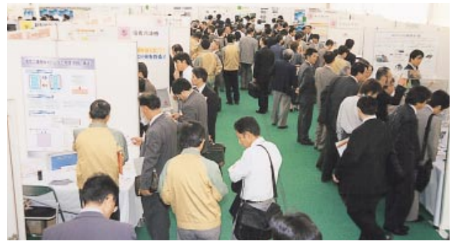
テーマパビリオン内の様子