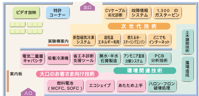
テーマパビリオン配置図