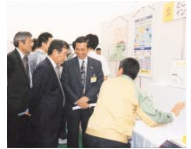
社長への説明風景

すくなったようです。今後もより良いフェアとしていくつもりですので、次回も多数のみなさまのご来場をお待ちしております。