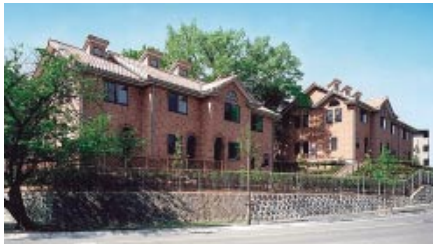
中部電力 八事賃貸住宅 「セレブタウン八事」 新設工事