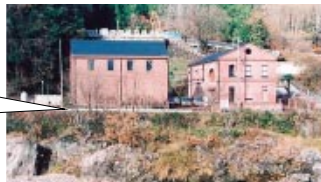
中部電力長良川発電所 文化財 耐震補強工事