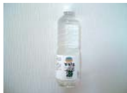
ひのき水1ℓペットボトル