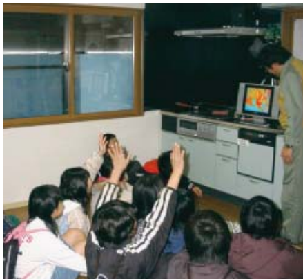
床暖房研究の説明

小学生からは、超電導の実験では、おもしろいと言ってなかなか実験設備から離れなかったり、床暖房などの研究では、私の家もオール電化にしたいなどの声が聞かれ、その他の実験棟でも研究員へ質問責めとなるシーンもあり、小学生の技術開発に関する興味の深さに、驚きました。