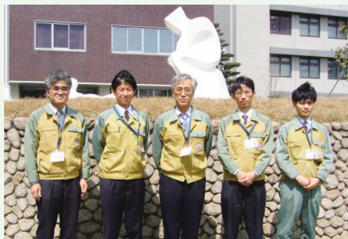
CO 2 削減技術グループメンバー

今後、環境部など社内外の関係部署と連携を図り、CO 2 分離・回収・固定および生物利用技術などについて情報収集しつつ研究開発を行い、研究の進展に合わせ体制の強化充実も図っていきます。