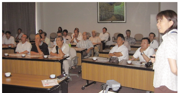
講演を聴く農業経営士のみなさん