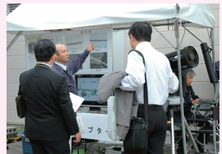
写真6 グループ会社の技術紹介

弊社ホームページでバックナンバーがご覧いただけます。TOP 画面右上のサイト内検索に下記のように入力して、ご利用ください。