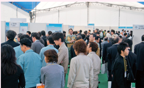
写真1 多くの来場者でにぎわうテーマパビリオン