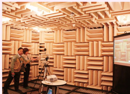
写真2 音メガネの実演