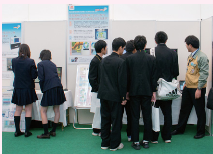
写真4 展示物を見る高校生