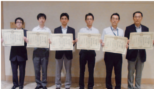
論文賞を受賞された皆さん