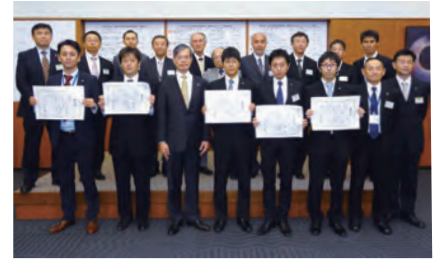
優秀賞を受賞された皆さん(ポスターセッション)