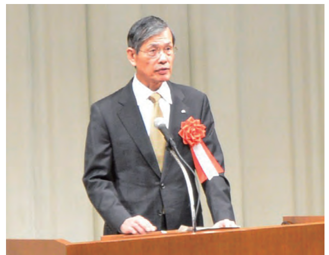
社長 冒頭あいさつ

開催にあたり、水野社長は「電力設備の設計・施工・運転・保守に亘って効率化に役立つ技術研究開発をさらに進め、さらなる費用削減に取り組み、強靱な事業基盤をつくりあげなければならない。また、将来の成長を見据え、電気事業における競争力の強化に向けた技術研究開発も着