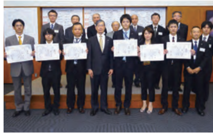
優秀賞を受賞された皆さん(ステージ発表)