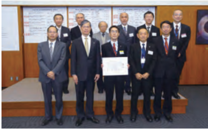
奨励賞を受賞された皆さん