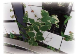
斑入りツルニチニチソウ