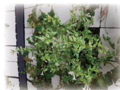
アベリア`ホープレイズ`