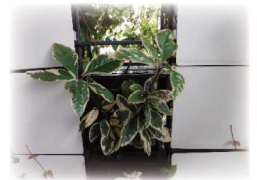
斑入りヤブコウジ