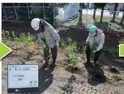
ポット苗植付状況