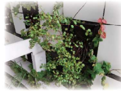
ワイヤープランツ