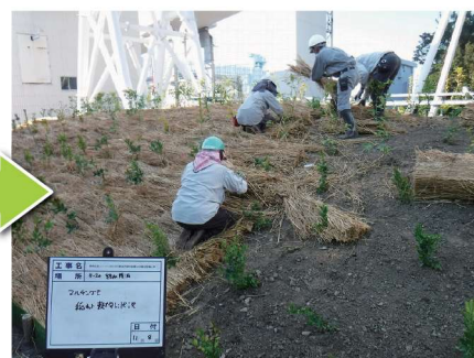
ワラマルチング敷設状況