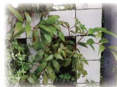
セイヨウイワナンテン 'アキシラリス'