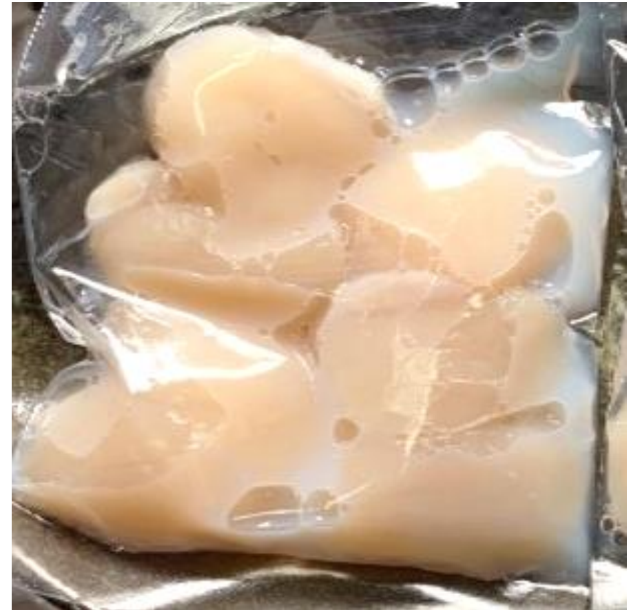
急速解凍でうまみ成分が流出 (ホタテ)