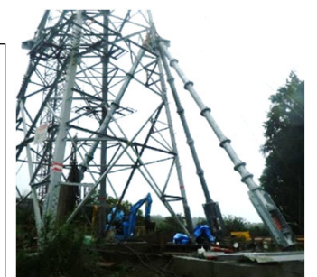
三又サポートによる基礎材・基礎体の改修