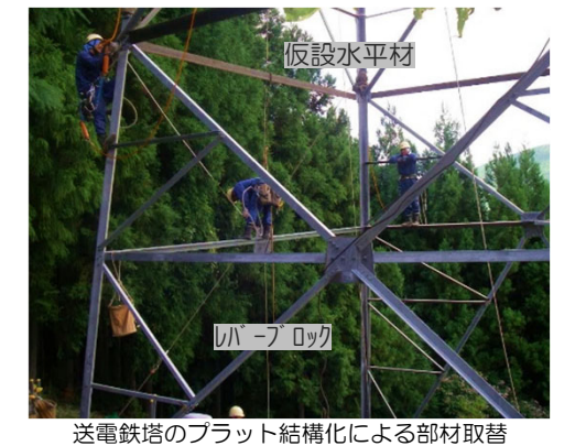
送電鉄塔のプラット結構化による部材取替