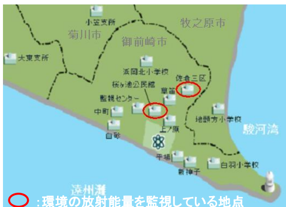
モニタリングステーション位置図