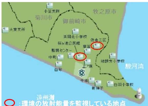
モニタリングステーション位置図