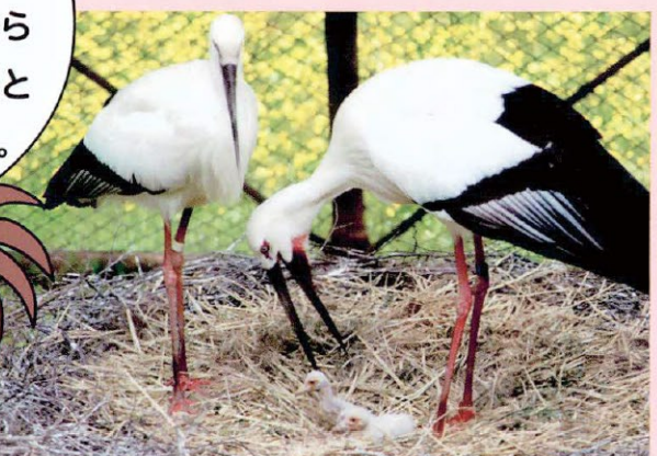
子育てをするコウノトリ

毎年約4万種もの生き物が様々な理由で、地球上からいなくなっているといわれている。