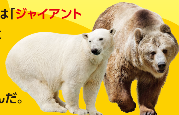
ホッキョクグマ ヒグマ