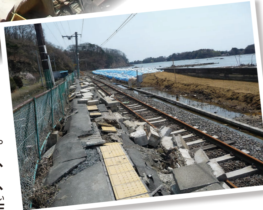
東日本大震災 陸前高田駅の被害の様子

災害を防ぐ取り組みや身を守ることを「防災」というよ。特に気をつけなくてはいけないのは、地震、台風、大雨、雷などによる自然災害。いつ起きるかわからないので、ふだんから防災の備えをして、防災を意識しながら生活することが大切だよ。