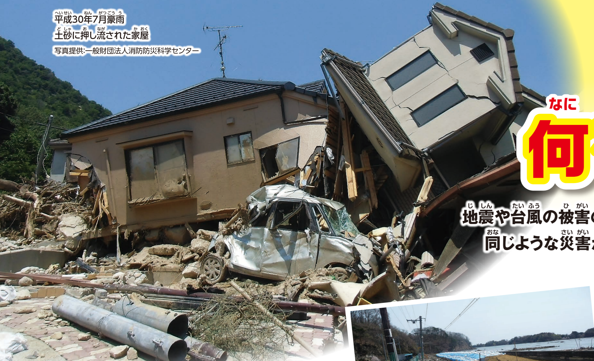
平成30年7月豪雨 土砂に押し流された家屋