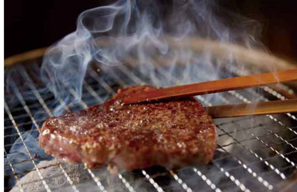
肉を焼く時は金属製ではなく竹製のトングを使う。金属を肉にあてることで化学反応が起こる可能性を極力避けるためである。