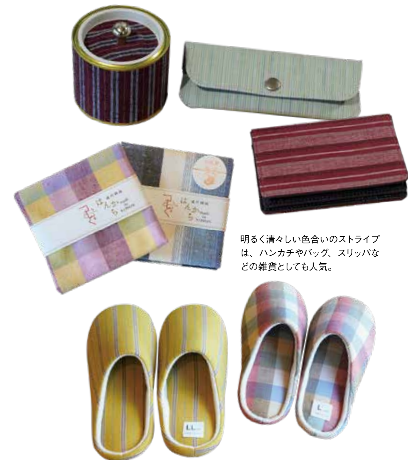
明るく清々しい色合いのストライプは、ハンカチやバッグ、スリッパなどの雑貨としても人気。