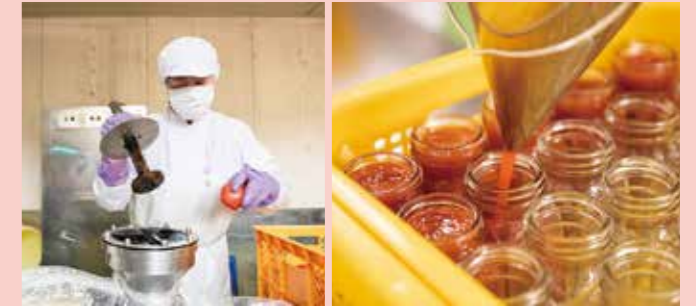
春から秋の間、明宝レディースには大小さまざまな大きさのトマトが毎日届く。そのトマトは、一つずつ丁寧につぶされてケチャップ生産の工程に。