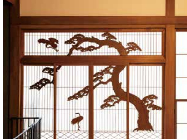
もともと残されていた意匠をそのままに。