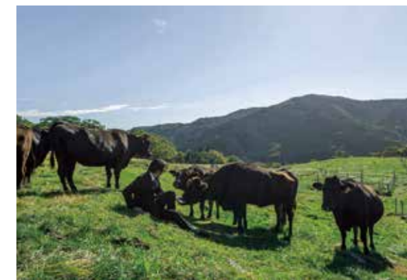
繁殖から牛を育てるプロジェクトを開始した。