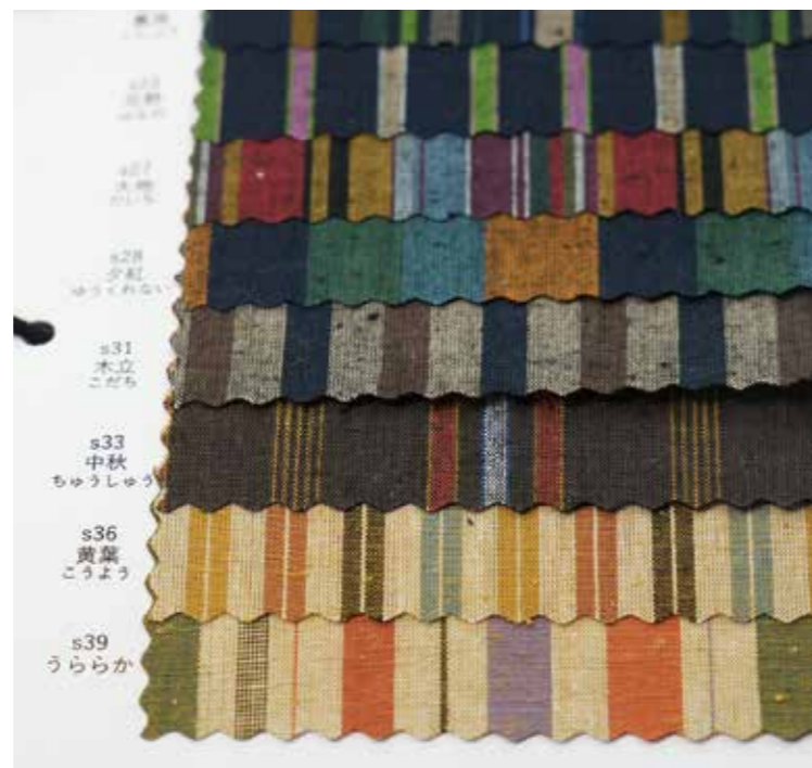
ぬくもり工房にある生地の見本帳。数えきれないほどの柄が保存されている。