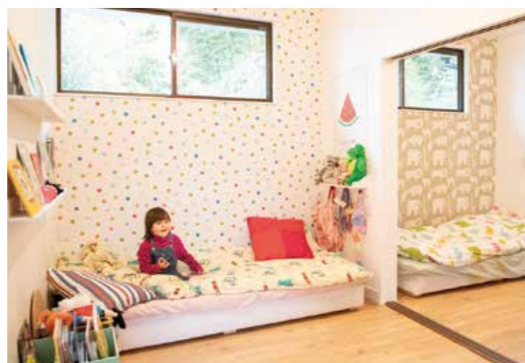
子ども部屋は明るい壁紙に。