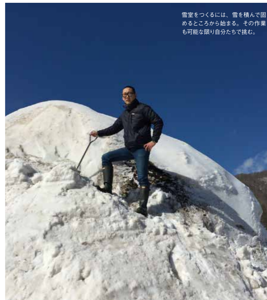
雪室をつくるには、雪を積んで固めるところから始まる。その作業も可能な限り自分たちで挑む。