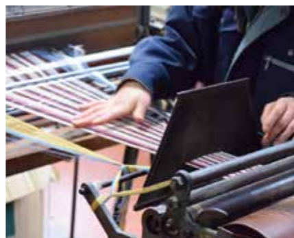
糸を染色し、縞模様になるように糸を並べて整え、自動織機で織り上げていく。1つの機械で1日に約2反(約25メートル)ができる。

さらにこの縞模様に“十二単 かさね の襲の色目”の魅力を見出した。襲の色目とは、十二単の衣の重なりに季節を表す色を組み合わせたもの。十二単の襟元を想像してみると、確かにそこは縞模様になっている。日本古来の縞模様の感性こそ、遠州綿紬にも共通する魅力である、と定義し、自らをストライププロデューサーと名乗って、ブランディングをスタートさせた。