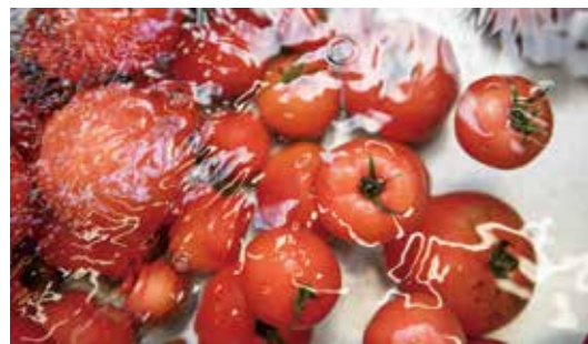
Cover photo 明宝トマトケチャップの原料トマト (株式会社 明宝レディース/岐阜県郡上市)

中部電力がお届けする、私と暮らしの「この先」を提案するライフナビゲーションメディア「交流Style」。「交流Style Magazine」では、その中から厳選したコンテンツをお届け。今号は、「ライフスタイルのこの先」をテーマに、衣・食・住にまつわる物語をご紹介します。