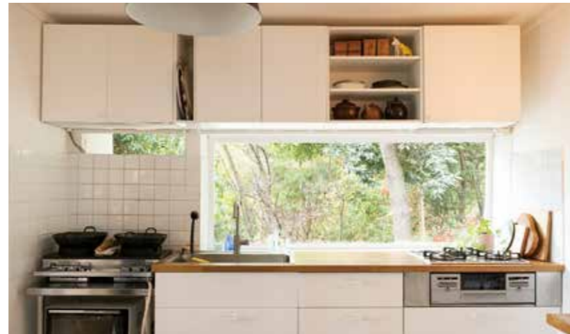
キッチンには、四季折々の景色を切り取る大きな窓が。