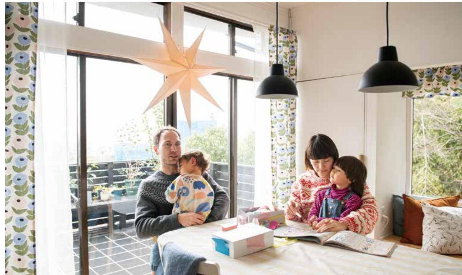
見晴らしがよくて明るいダイニング。最初にDIYに取りかかったのがこの部屋。