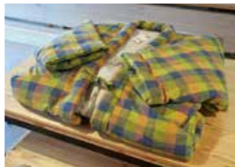
めくもり工房 めくもりこうぼう の「遠州綿紬」は、着物の反物としてはもちろん、ワンピースやスカート、ブラウスなどのファッションアイテムになっている。

平安時代に十二単 まゝと を纏っていた女性たちは、12枚の色の合わせ方に季節を表現するというルールを生み出し、オシャレを楽しんでいたと言われている。この古来のファッションを現代の綿に当てはめて新しい提言をしているのが、静岡県浜松市のめくもり工房。江戸時代から伝わる遠州織物を未来へと橋渡しする取り組みに注目し、お話を伺った。