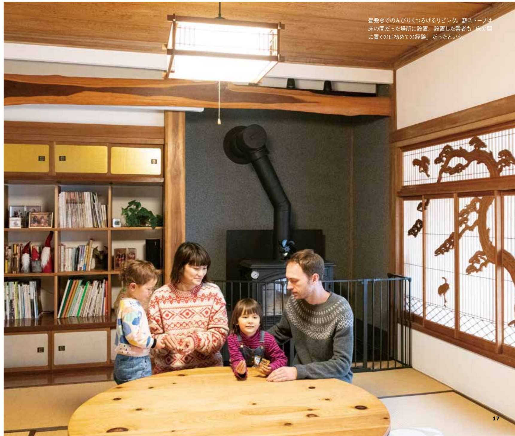
畳敷きでのんびりくつろげるリビング。薪ストーブは 床の間だった場所に設置。設置した業者も「床の間 に置くのは初めての経験」だったという。