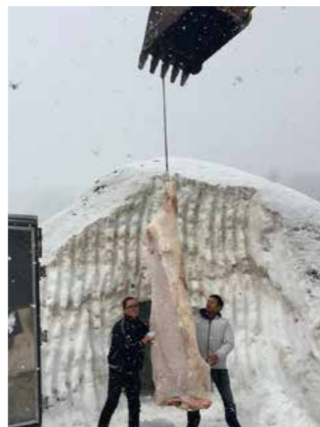
ファンボギの熟成庫で貯蔵されている熟成肉。

雪山を削って雪室の形に整え、牛肉を一分ごとクレーンで運ぶ様子。豪雪地帯といわれる岐阜県飛騨地方でも、雪が積もらず、雪室をつくることができない年があったという。スノウエイジングへの挑戦は、地球温暖化に警鐘を鳴らし続けることでもある。