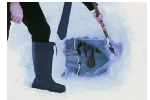
雪の中にスチールラックを置き、食肉を吊るし、外側をビニールで覆って雪室に。

雪国の人々にとって、雪は道を閉ざしてしまう厄介な一面がある一方で、秋の実りを春まで貯蔵するために必要な天然資源でもあるのだ。そしてそんな雪 すごう 国の風習に倣い、岐阜県郡上市や飛騨地方の数河高原で、食肉を雪室に吊るして熟成させる活動がおこなわれている。