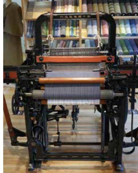
1915年頃に製作された自動織機が店内に展示されている。スズキ株式会社の起源となる鈴木式織機製作所のもの。