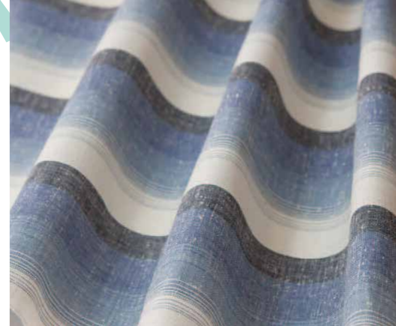
濃紺から青、そして白へのグラデーション柄は、日本・静岡を象徴する富士山をイメージした「富士」という柄。白は山頂の雪化粧を表す。ぬくもり工房では、モチーフから独自の柄を生み出すこともおこなっている。