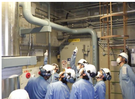
原子炉格納容器下部注水系配管の点検の様子

注1 自主的に取り組んできた重大事故対策や、2013年7月に施行された原子力規制委員会の新規制基準を踏まえ追加した対策工事などのことです。