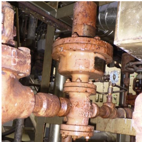
漏えいが確認された弁