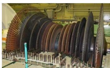
タービンロータ1本の写真