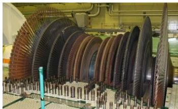
タービンロータ 1 本の写真