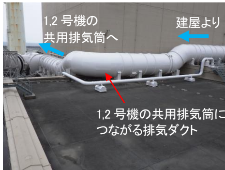
切り替え前の排気経路の写真(1号機の例)

当社は、今後、排気筒解体撤去工事として、排気筒内部の配管やこれを支持する構造物から解体撤去を進めてまいります。