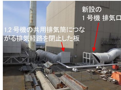
切り替え後の排気経路の写真(1号機の例)