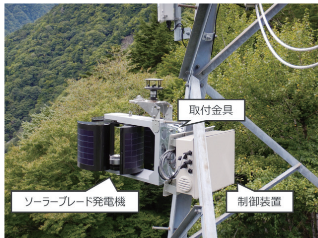
第2図 鉄塔に設置したハイブリッド電源装置写真

ハイブリッド電源装置は、風力羽根に太陽光パネルを張り付けた世界初のソーラーブレード方式という特徴を持つ。山間部において、太陽光発電だけでは山影や積雪などで発電効率が低いため、昼夜問わず発電できる風力発電を組み合わせたハイブリッド発電方式を採用した。この風力羽根は特許技術の形状により、台風や突風でもカットアウトがなく、騒音や振動も少ない。悪天候（無日照無風）が3日間続いても、1ワット級のIoT機器への電源供給が可能である。また、小型・軽量（重さ12.6kg、高さ50cm）で、パーツ分割できることから、送電鉄塔などの高所への取付作業も容易である。静岡県大井川の山間部にある送電鉄塔に実際に取り付け、越冬実証実験を行い、安定稼働を確認した。