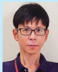
執筆者 先端技術応用研究所 情報技術グループ 内山 功次

山間部におけるIoTネットワークの構築では、LPWA無線機などのIoT機器への安定的な電源供給が課題であり、それを解決するため、エコ・テクノロジー社と共同で、自然エネルギーを利用した小型独立電源装置を試作開発し、現場での実証検証を行った。