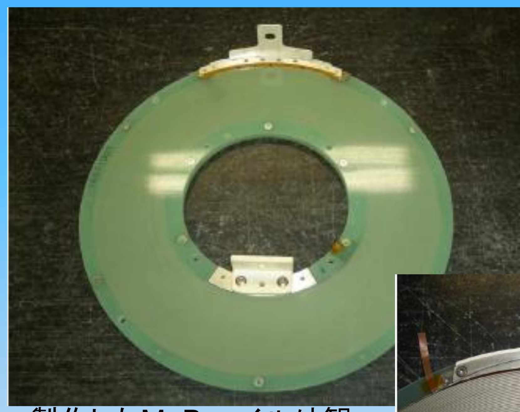
製作したMgB 2 コイル外観