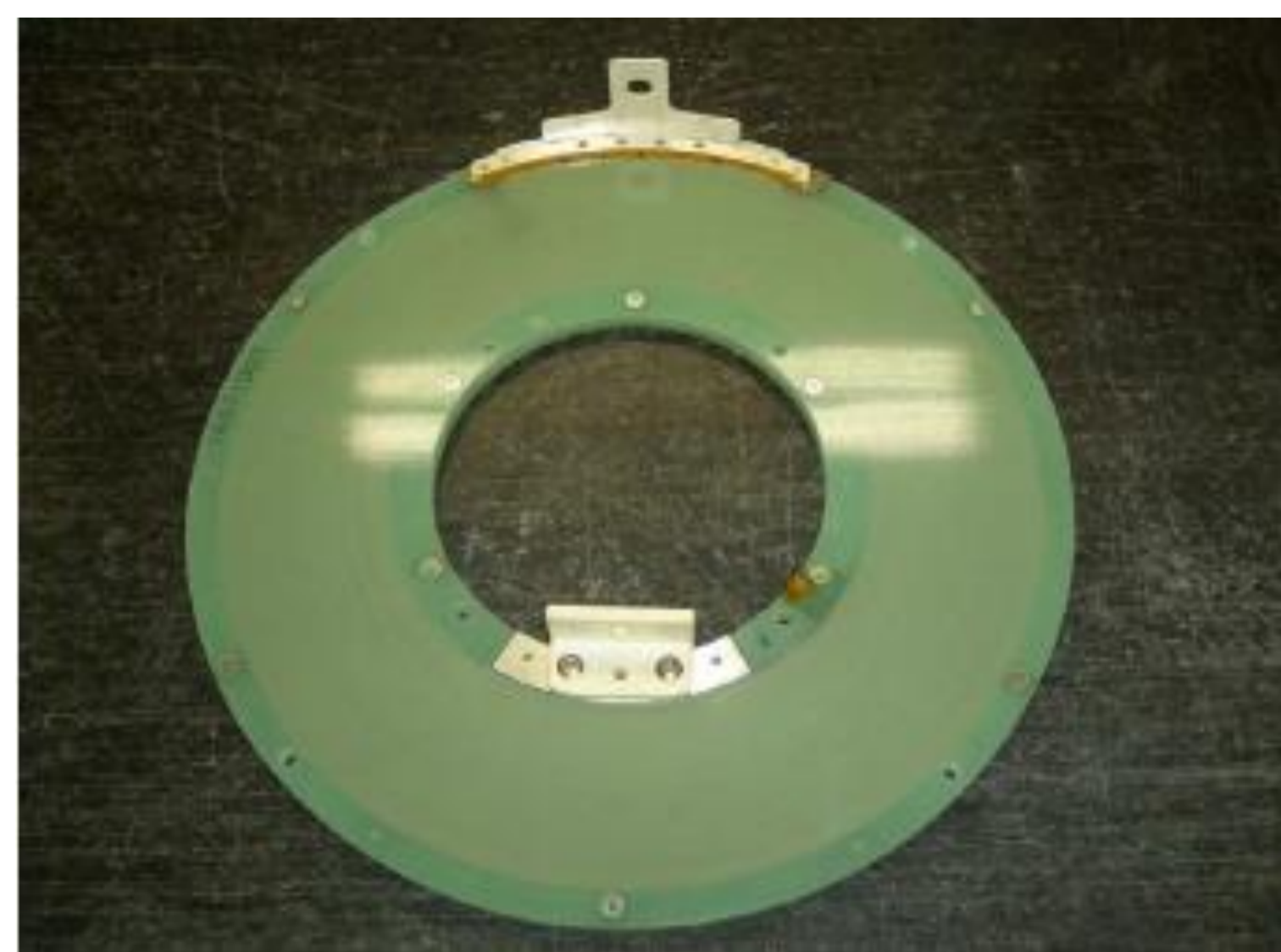
・Columbus社MgB 2 線材使用