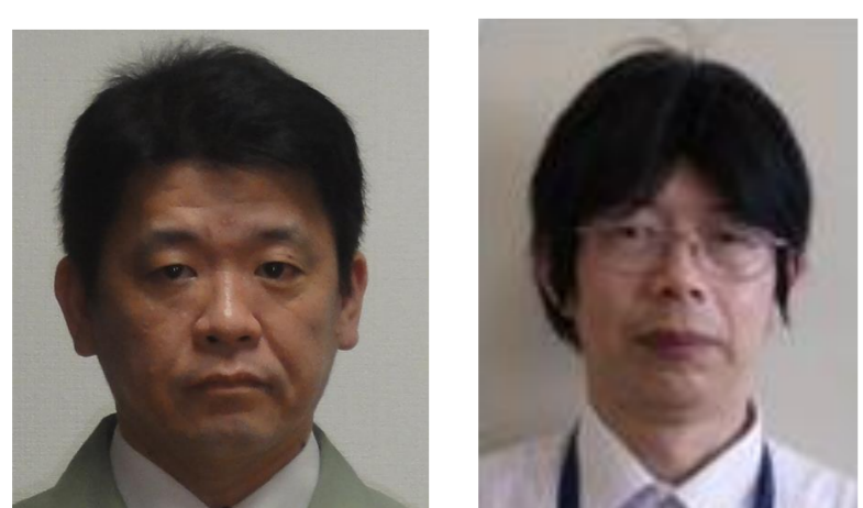
長 伸朗 三摩 達雄

開発当初はなかなか思うように油汚れを落とせませんでした。水蒸気ノズルの構造や水の供給方法など、多くの試行錯誤を重ねて洗浄性能を確保しました。