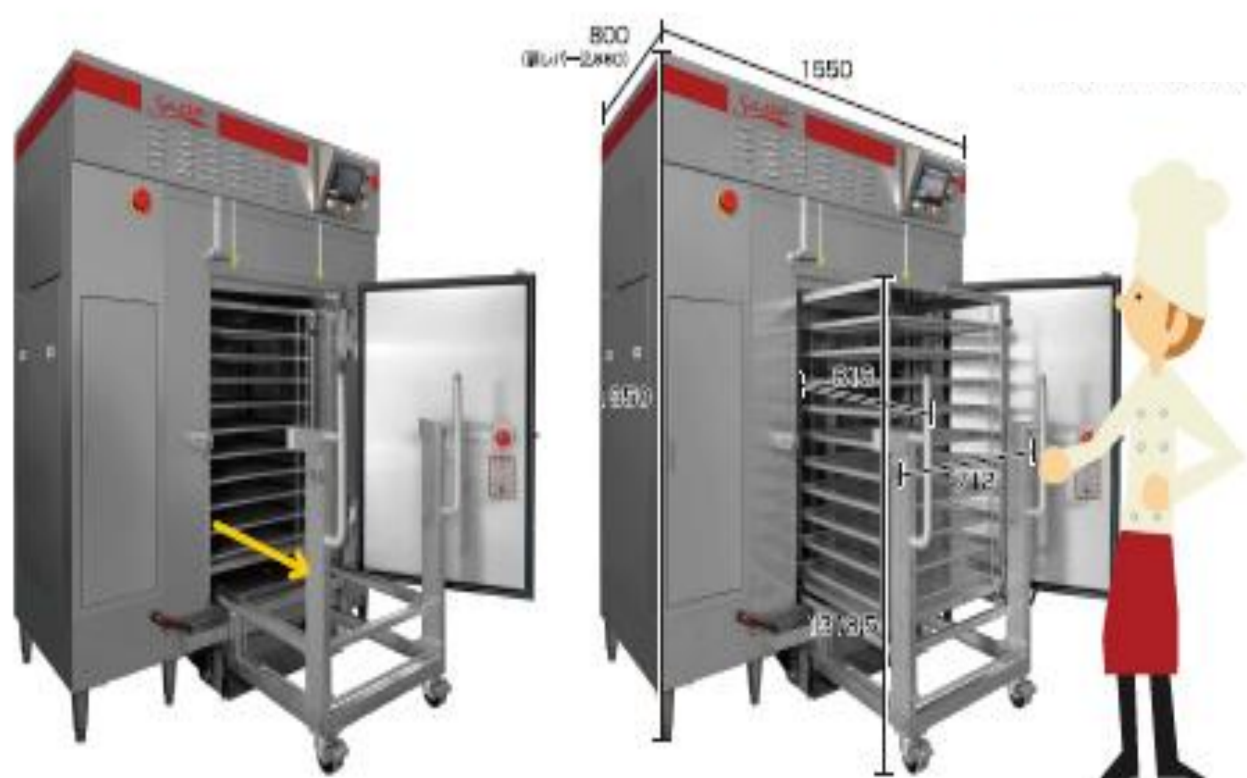
入替作業のイメージ